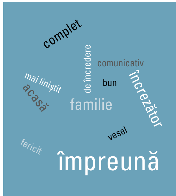
FIGURA 2. CUVINTE FOLOSITE DE PĂRINȚI

posibilitatea de a se afla cu copiii care au fost „la fel” ca ei. Cei care au plecat pentru prima oară din instituțiile rezidențiale au fost informați cu privire la această plecare în diferite moduri și de către mai mulți specialiști. Unii dintre ei își amintesc stând în fața unui grup de oameni, format din personalul didactic, un psiholog, un membru al personalului Lumos și directorul instituției rezidențiale, în timp ce alții au fost informați de angajați în parte. Toți tinerii au vorbit despre temerile și preocupările lor când au aflat că vor ieși din sistemul de îngrijire. Temerile lor se refereau la ce se va întâmpla cu ei, cum se vor integra în familiile lor, comunități și școli. Unii tineri s-au integrat deja în sistemul școlar local cu ceva timp înainte de a ieși efectiv din instituția rezidențială.